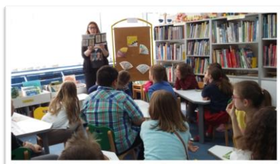
Bum, tres, trans Savica